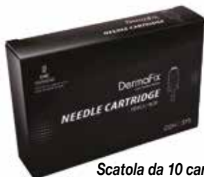
Scatola da 10 cartucce

Le cartucce aghi di DERMAFIX sono sterilizzate per garantire totale sicurezza e igiene e, grazie a un design unico nel suo genere, permettono di evitare la contaminazione del dispositivo da parte di sangue o soluzioni.